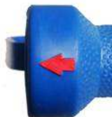
Strzałka wskazująca kierunek strumienia