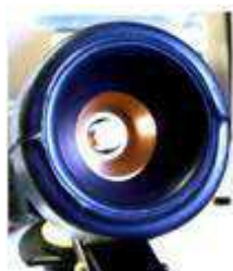
Duży otwór wylotowy